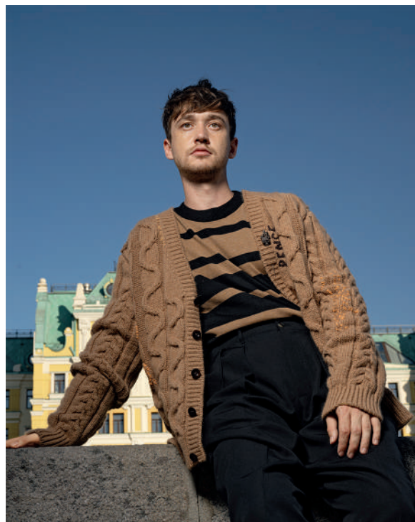
Джемпер, FINN FLARE ; кардиган, PENCE ; брюки, PT TORINO ; булавка, GREGORY LEPS JEWELRY

только среди коллег и зачастую не знаешь, что в итоге может получиться и что войдет в окончательный монтаж из сыгранных тобой дублей. У кино больше выразительных ресурсов, средств и масштаба. Безусловно, театр и кино конкурируют друг с другом за артистов, и очень небольшому количеству из них удается совмещать два этих вида искусства. Есть артисты, воспитанные театром, которые всю жизнь могут посвятить ему одному. А есть те, кто в самом начале “обожглись” и раз навсегда приняли решение избегать театральной сцены. Про театр говорят, что там служат, и я на собственном примере это осознал. Поэтому в определенный момент понял, что не могу совмещать, и принял решение уйти. Этот опыт, безусловно, сильно на меня повлиял, я очень ему благодарен.