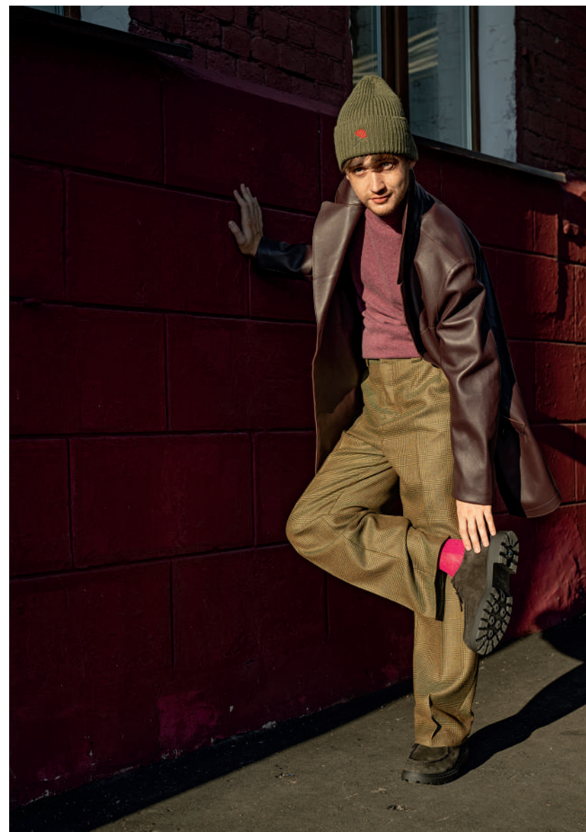
Джемпер с горлом, JUST IN TIME ; бушлат, GIAMPAOLO ; брюки, PT TORINO ; носки, FALKE ; шапка, AEROCLUB ; ботинки, GEOX

Понятно, что новые технологии сильно меняют кино, но насколько они затрагивают театр?