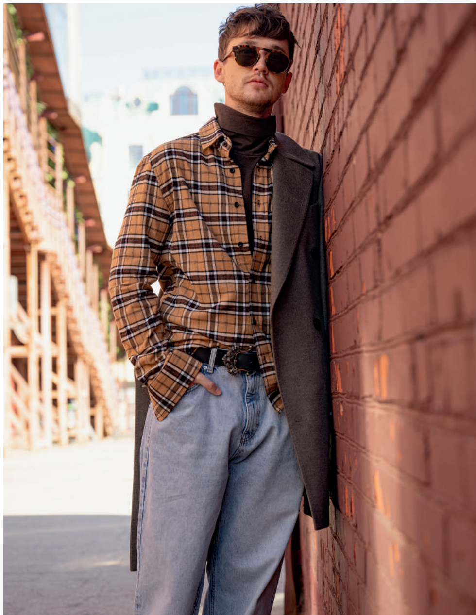
↑ Водолазка и рубашка, JUST CLOTHES ; джинсы, BEFREE ; пальто, JUST IN TIME ; ремень, GREGORY LEPS JEWELRY ; очки, BOGGI MILANO