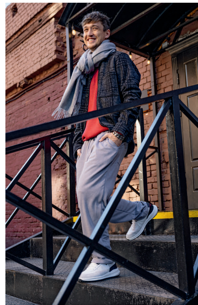
↓ Куртка-рубашка, STRELLSON ; джемпер, FINN FLARE ; брюки, KCHTZ ; шарф, JUST CLOTHES ; кроссовки, GEOX ; браслеты, GREGORY LEPS JEWELRY