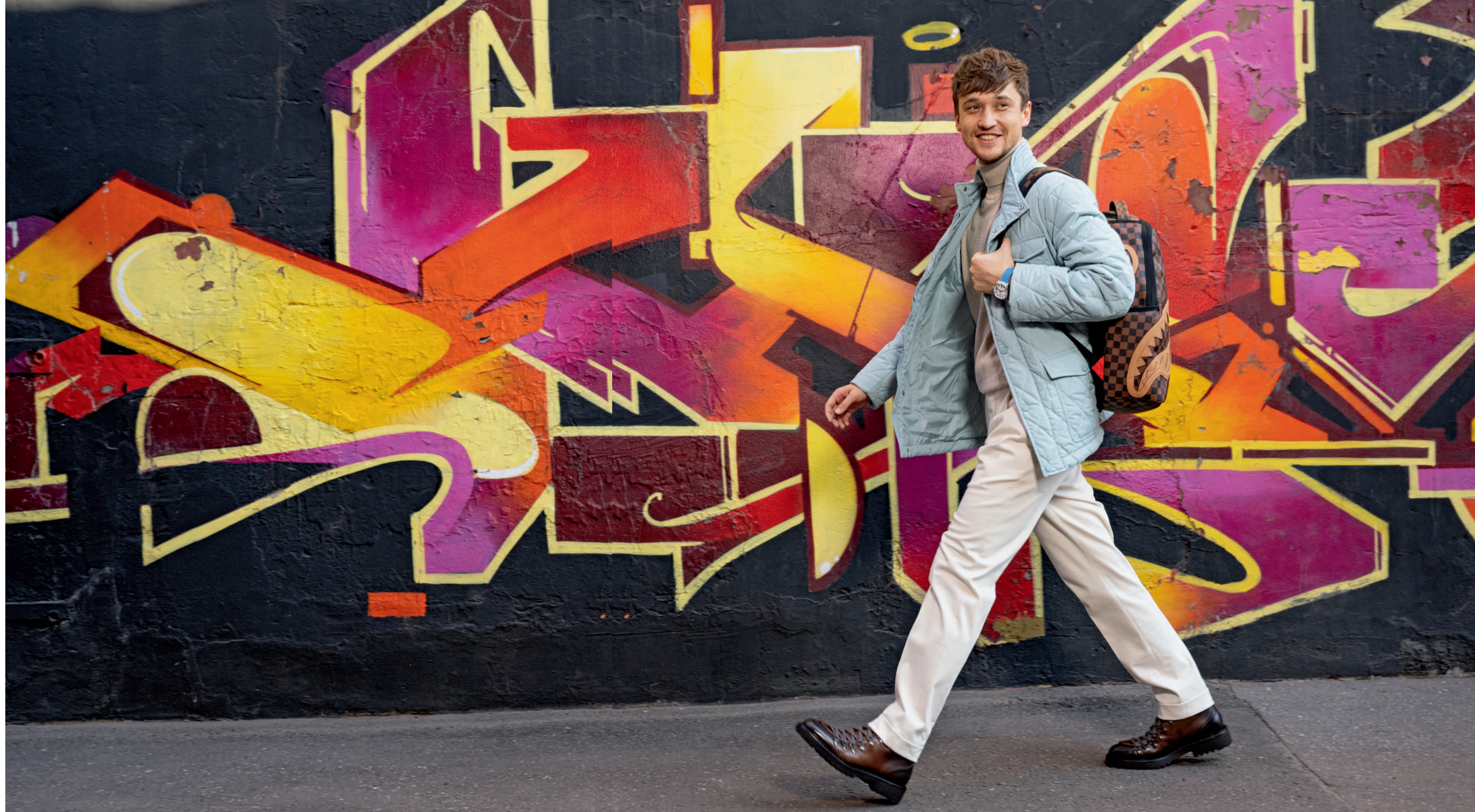
↑ Куртка, FINN FLARE ; джемпер с горлом, BEFREE ; брюки, PT TORINO ; ботинки, DOUCAL'S ; рюкзак, SPRAYGROUND, NO ONE ; часы, "PAKETA", BIG LOVE